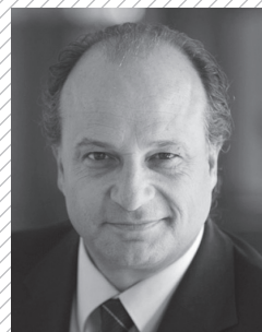
Moderation Filippo Leutenegger, Verleger und Nationalrat